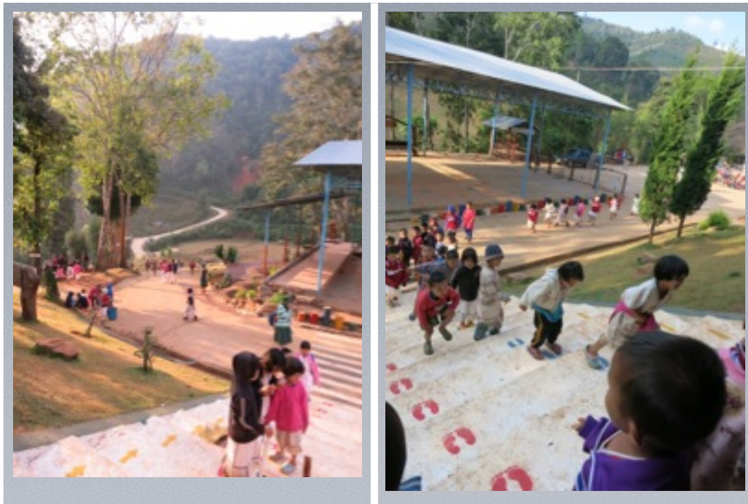
บรรยากาศโรงเรียนบ้านแม่ลิต

ปัจจุบันการจัดการศึกษาสังคมไทยบางครั้งยังมุ่งการวางรากฐานมาตรฐานการศึกษาแบบเดียวกันทั้งในสังคมเมืองและสังคมในชนบท ซึ่งในความเป็นจริงแล้ว ในแต่ละท้องถิ่นต่างต้องการความเฉพาะในการจัดแนวการศึกษาโดยเฉพาะสื่อและสิ่งแวดล้อมสำหรับการเรียนรู้ที่ควรสอดคล้องกับเอกลักษณ์ของแต่ละท้องถิ่น ดังเช่น การจัดการศึกษาให้กับเด็กอนุบาลของกลุ่มชาติพันธุ์ชาวไทยภูเขา ชนเผ่ากะเหรี่ยง ซึ่งมีเอกลักษณ์ของวัฒนธรรม ความเชื่อ และแนวทางการดำรงชีวิตที่เด็กจำเป็นจะต้องมีการปรับตัวให้เข้ากับสังคมในปัจจุบันและสังคมของชนชาติไทยควบคู่กับการธำรงรักษาวัฒนธรรมประจำเผ่า การจัดแหล่งเรียนรู้ที่คำนึงถึงภูมิปัญญาและวัฒนธรรมและการปรับตัวกับวิถีชีวิตไทยจึงเป็นแนวทางหนึ่งที่ทางสาขาวิชาการศึกษาปฐมวัย คณะครุศาสตร์ จุฬาลงกรณ์มหาวิทยาลัยให้ความสำคัญและมีแนวนโยบายในการพานิสิตทั้งระดับปริญญาบัณฑิต ระดับมหาบัณฑิตที่จะนำความรู้จากการศึกษาเล่าเรียนสู่การปฏิบัติในการประยุกต์วิธี