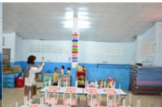
สภาพห้องเรียนที่ห้องน้ำและห้องเรียนอยู่ติดกันมีเพียงกำแพงกัน จึงจะติดราวเพื่อทำตุ๊กกันระหว่างห้องเรียนและห้องน้ำ